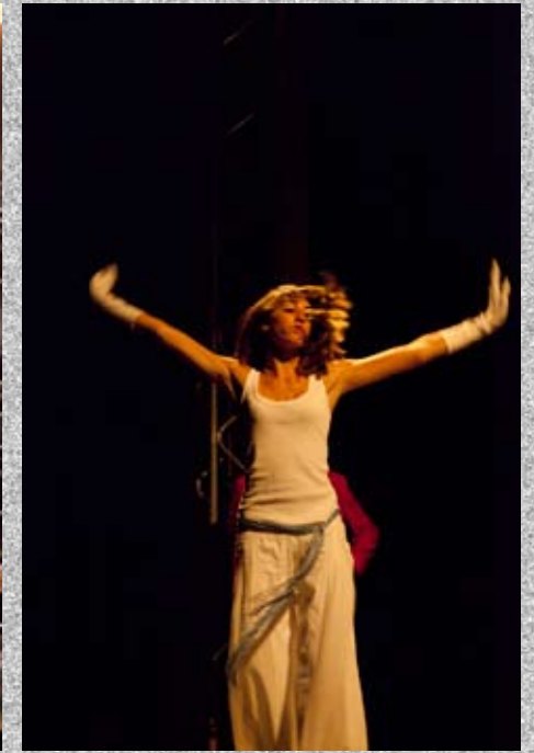
Les artistes du cirque Continental